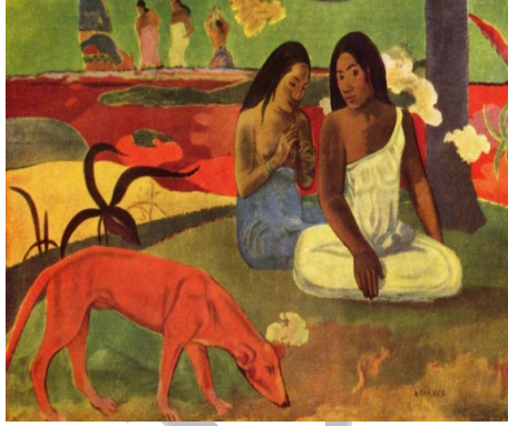
Resim 19. Paul Gauguin, “Arearea”, 1892, Tuval Üzerine Yağlı Boya, Orsay Müzesi, 74,5cmx93,5 cm, Fransa