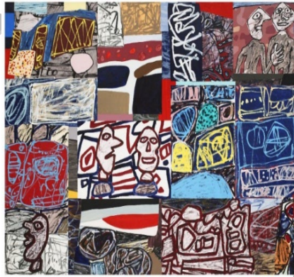
Resim 20. Jean Dubuffet, “Köy Eğlencesi”, Kâğıt Üzerine Akrilik ve Kolaj, Fransa, 247.7x321.3 cm, Paris