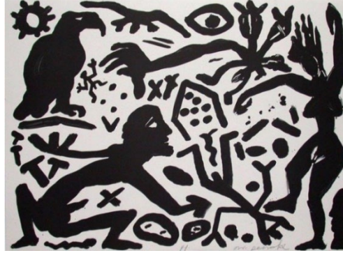
Resim 7. A.R. Penck eseri “Şu An ki Durum” (siyah ve beyaz), 1992 91.4 x 123,2 cm

Kaynak: https://www.artspace.com/ar_penck/the-situation-now-black-and-white