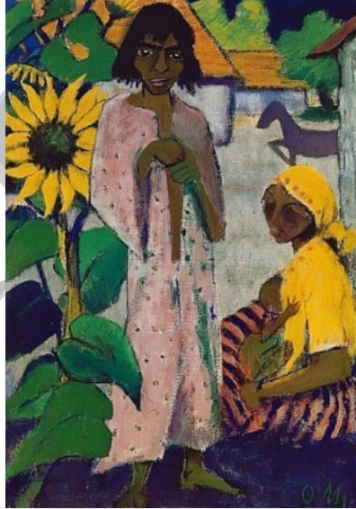
Resim 7. Otto Mueller, “Çingenerler ve Ay Çiçekleri”, 1927, Çuval Üzerine Tutkal Boya, 105cm x 145 cm, Saarland Müzesi Almanya