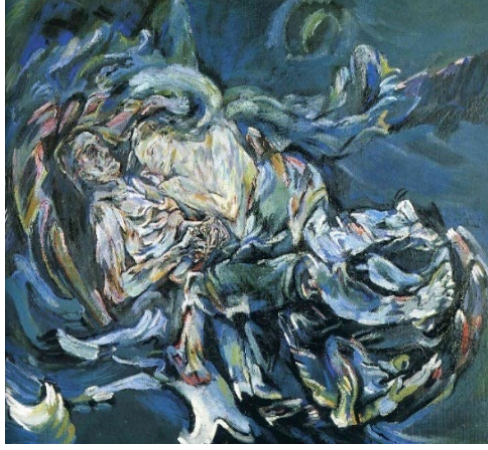
Resim 21. Oscar Kokoschka, “Rüzgârın Gelini”, 1913-1914, Tuval Üzerine Yağlı Boya 180.4 x 220,2 cm, İsviçre Basel

Kaynak: Die Windsbraut (The tempest) (1914) by Oskar Kokoschka – Artchive