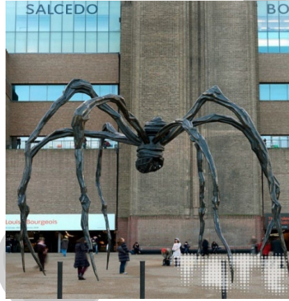
Resim 8. Louise Bourgeois, “Anne”, 2000, Çelik ve Mermer, 927 x 891 x 1024 cm, Tate Modern Müzesi, İngiltere