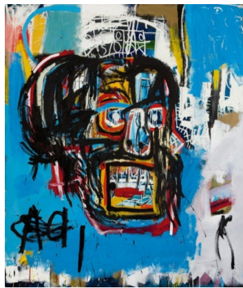
Resim 6. Jean-Michel Basquiat, “İsimsiz”, 1981, Tuval Üzerine Akrilik ve Pastel Boya, 205.74 x 175,9 cm, Brooklyn Müzesi Amerika