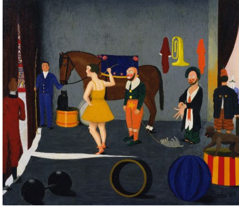
Resim 15. Camille Bombois, “Ringe Girmeden Önce”, 1939, Tuval Üzerine Yağlı Boya, 60 x 73 cm Modern Sanatlar Galerisi (MoMA), Amerika

Kaynak: Camille Bombois. Before Entering the Ring. 1930-35 | MoMA