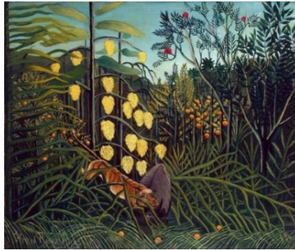
Resim 17. Henri Rousseau, “Kaplan ve Bufalonun Savaşı”, 1908, Tuval Üzerine Yağlı Boya, Cleveland Müzesi

Kaynak: Museum Art Reproductions Voyage to Labrador by Alfred Wallis (1855-1942, United Kingdom), WahooArt.com