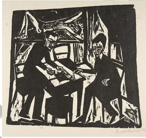
Resim 22. Erich Heckel, “Masada İki Adam”, 1912, Tuval Üzerine Yağlı Boya, 23,5×26,2 cm, Almanya

Kaynak: Die Windsbraut (The tempest) (1914) by Oskar Kokoschka – Artchive