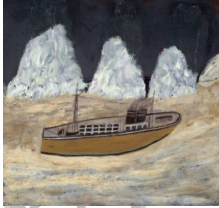
Resim 16. Alfred Wallis, “Labrodor’a Yolculuk”, 1928, Yağlı Boya 37x39 cm

Kaynak: Camille Bombois. Before Entering the Ring. 1930-35 | MoMA