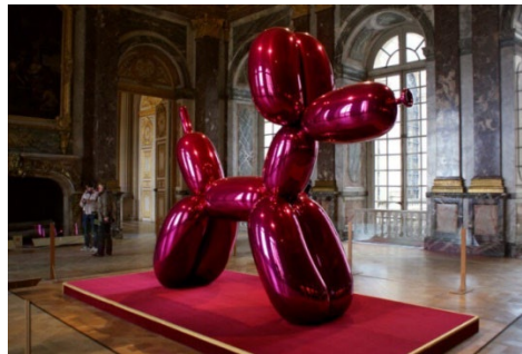
Resim 9. Jeff Koons, Balon Köpeği (Magenta) , 1994-2000, Versailles Şatosu, 307,5x366 x115cm, Transparan Boya Kaplama Yüksek Oranda Krom İçeren Paslanmaz Çelik, Fransa

Kaynak: https://www.tate-images.com/M01706-Louise-Bourgeois%27-Maman-sculpture-outside-Tate.html