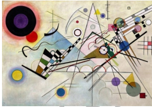
Resim 5. Wassily Kandinsky, “Kompozisyon 8”, 1923, Tuval Üzerine Yaęlı Boya, 140 cm x 201 cm, Guggenheim Müzesi, Amerika