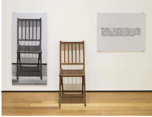
Resim 5. Joseph Kosuth, Bir ve Üç Sandalye, 1965, Ahşap Sandalye, Fotoğrafi ve Tanımı, Sandalye (82 x 37,8 x 53 cm), Fotoğraf (91,5 x 61,1 cm), Metin Paneli (61 x 76,2 cm),Modern Sanatlar Galerisi (MoMA), Amerika