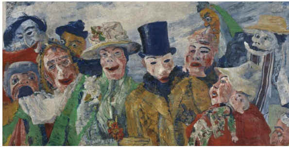
Resim 12. James Ensor, “Entrika”, 1890, Tuval Üzerine Yağlı Boya, 89,5x149 cm, Amerika