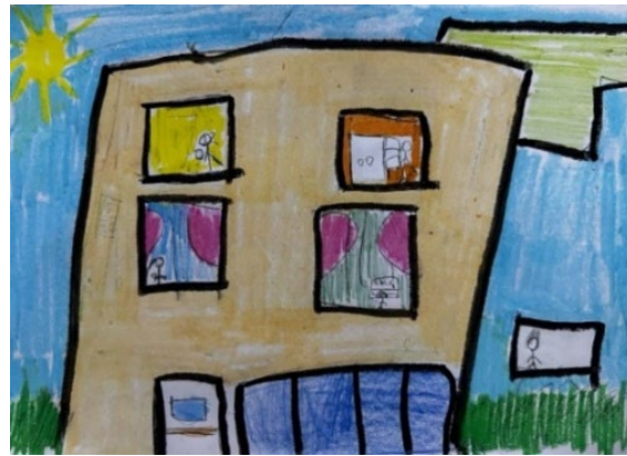
Resim 3. 7-9 Yaş Çocuk Resmi Örneği (Anonim)