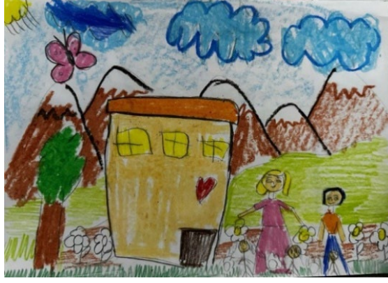
Resim 4. 9-12 Yař Çocuk Resmi Örneęi (Anonim)