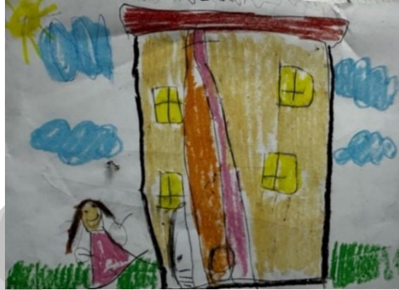
Resim 2. 4-7 Yaş Çocuk Resmi Örneği (Anonim)