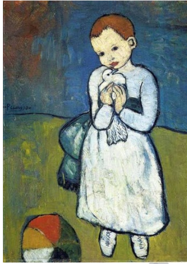
Resim 13. Pablo Picasso, “Güvercinli Çocuk”, 1901, Tuval Üzerine Yağlı Boya, 73x54 cm, Katar Müzeler Kurumu