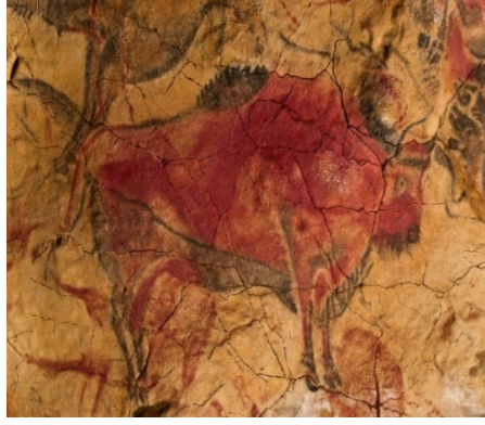
Resim 18. Mağara resimleri, “Altamira Mağrası”, İspanya

Kaynak: Lascaux - Vikipedi (wikipedia.org)