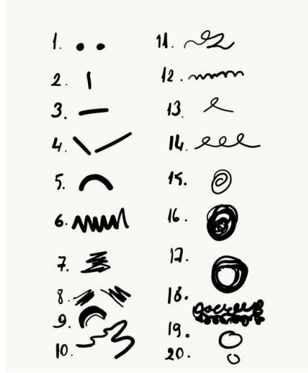
Resim 1. Kellogg'dan 20 Temel Karalama Örneği